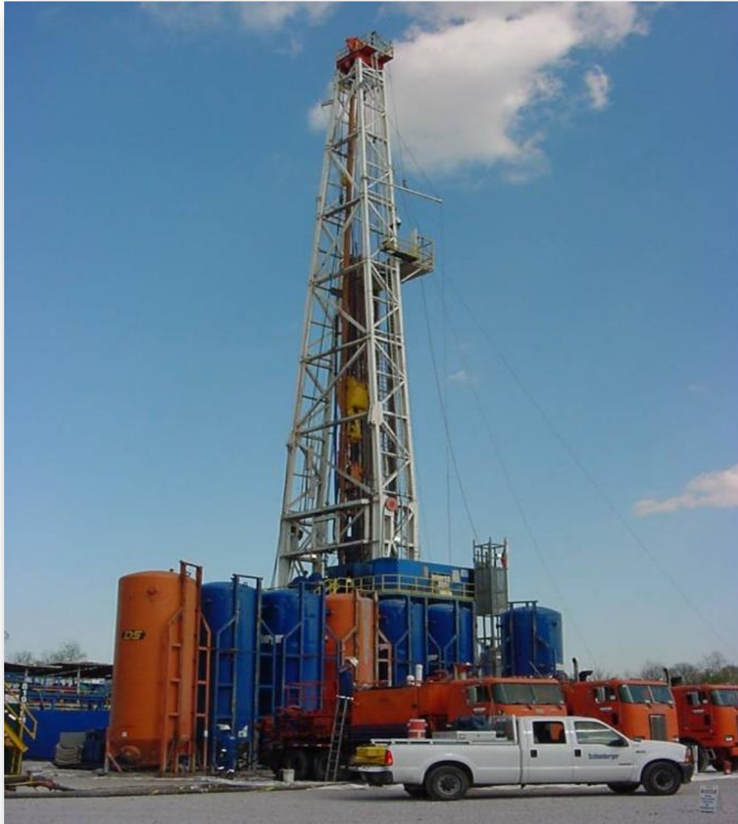
National 1625M – 3000 HP SCR Drilling Rig Package